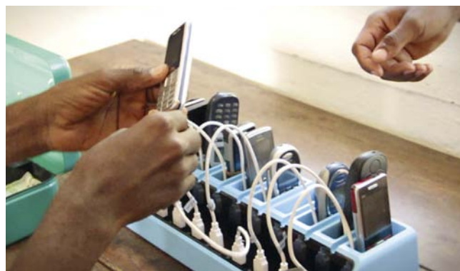
Ladegerät für Mobiltelefone

Für die kostenlose Installation arbeitet Mobisol mit vor Ort ausgebildeten Technikern und Technikerinnen zusammen, was zusätzlich neue, lokale Arbeitsplätze schafft.