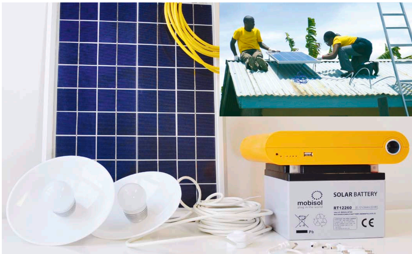
Solar Home Systems Kit mit Solarpanel und Zubehör