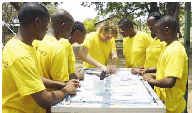
Mobisol bildet vor Ort TechnikerInnen aus