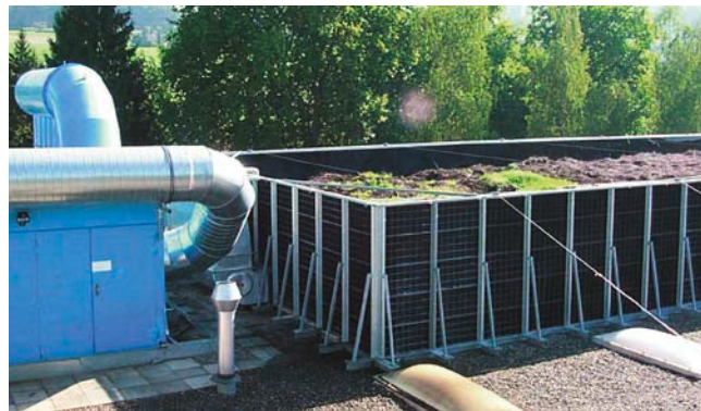
Biofilter-Anlage auf dem Firmendach

in den Produktionsprozessen und in der Produktentwicklung haben diese markante Entwicklung möglich gemacht.